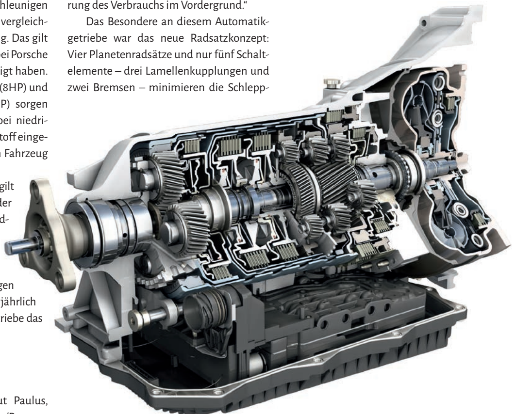
Bild 1. Das Automatikgetriebe basiert auf einem neuen Getriebekonzept mit vier Planetenradsätzen und fünf Schaltelementen.

verluste und erhöhen den Getriebewirkungsgrad (Bild 1). Helmut Paulus erklärt: „ZF konnte den Wirkungsgrad mit jeder neuen Getriebeentwicklung steigern. Das