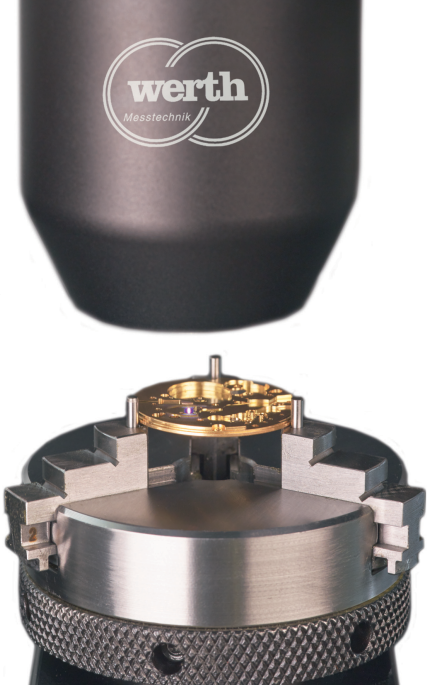
Der Chromatic Focus Line erfasst etwa eine Million Messpunkte in drei Sekunden Bilder: Werth

metrischen Eigenschaften, oft über 100, müssen an einem Musterwerkstück gemessen werden. Das Ergebnis sollte möglichst schnell vorliegen, damit sich eventuell Korrekturen am Herstellungsprozess vornehmen lassen.