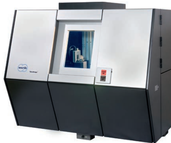
Bild 2. Die aktuelle Version des 2005 vorgestellten ersten Koordinatenmessgeräts mit Röntgentomografie – optional mit Multisensorik.

Jedem ist klar, dass ein taktiler Maßstab nicht mehr eingemessen ist, wenn zum Beispiel der Tastkugeldurchmesser geändert wird, ohne diesen erneut zu bestimmen. Analog kann man sich das Vorgehen für die Algorithmen zur Messpunktbe-