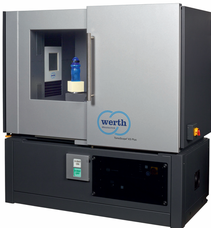
Bild 1. Heute erreichen auch Kompaktgeräte mit Computertomografie ebenso hohe Genauigkeiten wie konventionelle Koordinatenmessgeräte.

Heute werden fast alle Werkstücke ohne weitere Sensoren mit ausreichender Genauigkeit gemessen. Moderne Transmissi-