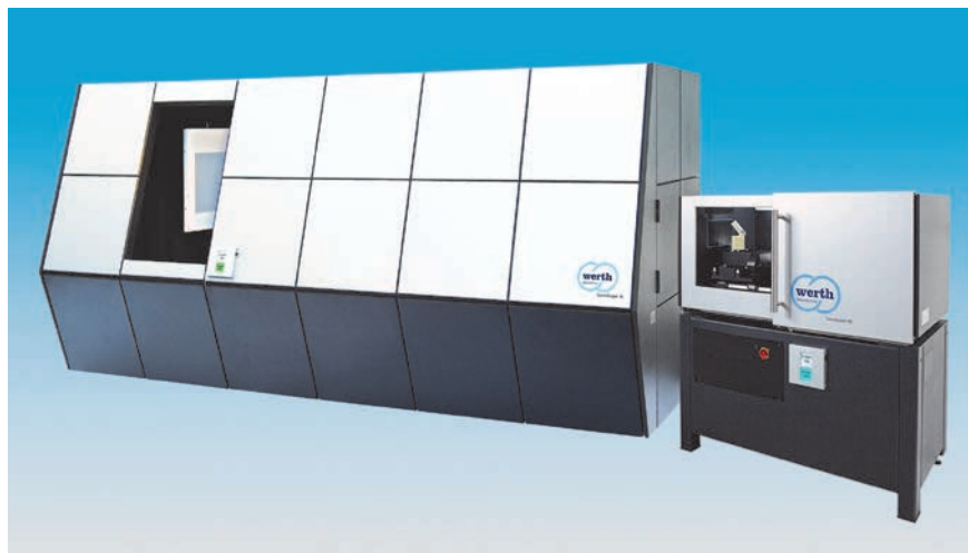
Bild 2. Kompakte Geräte können an fast jedem Ort aufgestellt werden: flexibles Messgerät für große Werkstücke (links), Kompaktgerät mit Transmissionsröhre im Monoblock-Design (rechts).

Durch die Kombination von Konstruktionsprinzipien der Koordinatenmesstechnik mit der Röntgensensorik realisierte Werth Messtechnik im Jahr 2005 das erste speziell für die Koordinatenmesstechnik konzipierte Gerät mit Röntgentomografie-Sensorik, optional mit Multisensorik (Herstellernangabe). Neben einer soliden Hartgesteinbasis kommen heute in diesen Geräten Präzisionsführungen, luftgelagerte Drehachsen, Temperatur- und 3D-Geometriekorrektur sowie viele andere Verfahren zum Einsatz. Langzeitstabil eingemessene Vergrößerungen gewährleisten die Rückführbarkeit der Messergebnisse und sparen Zeit. Heute