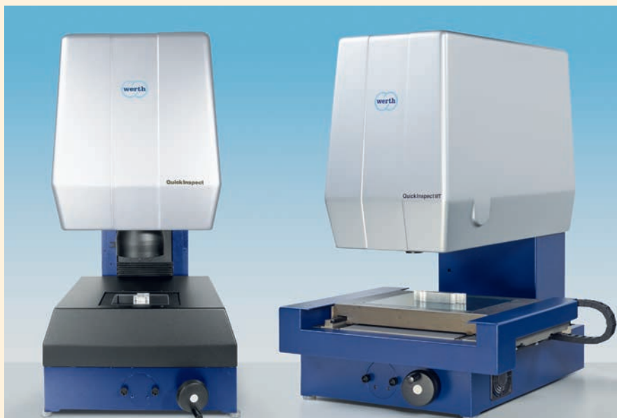
Bild 1. Messgeräte mit Bildverarbeitung erfassen das Messobjekt in einem Bild.

Die Betrachtung von Einzelmesswerten und einfachen Form- und Lagetoleranzen ohne Materialbedingungen kann zum Aussortieren funktionsfähiger Werkstücke führen. Die Auswertung nach dem Maximum-Material-Prinzip sowie der Konturvergleich mit toleranzonenabhängigem Einpassen bieten Möglichkeiten zur funktionellen Prüfung. Dies reduziert den Ausschuss und macht die Fertigung wirtschaftlicher.