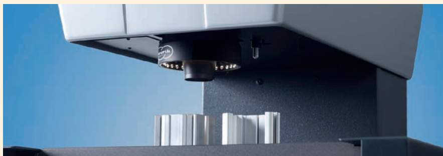
Bild 1. Mit diesem 2D-Messgerät werden auch große Werkstücke „im Bild“ gemessen.

Bei 2D-Messgeräten wie dem QuickInspect MT oder dem FlatScope, Werth Messtechnik, Gießen, wird die Werkstückgeometrie in der patentierten Betriebsart „Raster-scanning“ mit hoher Geschwindigkeit komplett und genau erfasst, in einem Bild dargestellt und ausgewertet. Auch die Maße an Abschnitten von Kunststoff- oder Aluminiumprofilen, wie zum Beispiel für Fensterrahmen oder Kfz-Bauteile, werden auf der Schnittfläche zweidimensional gemessen. Achtet der Anwender auf die passenden Rahmenbedingungen, wie einen rechteck-