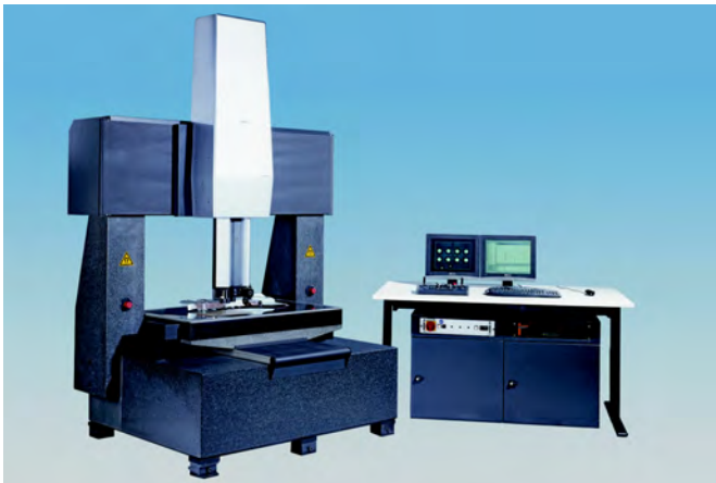
Bild 2: Werth Inspector FQ – das schnellste Multisensor-Koordinatenmessgerät

sensormesstechnik – und damit für Qualitätssicherung par excellence.